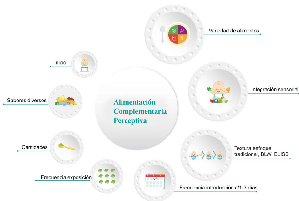
Figura 1 Componentes de la alimentación complementaria perceptiva.

fueron médicos, la mitad de los cuales cuentan con una formación en gastroenterología y nutrición pediátrica; el resto fueron nutricionistas (licenciadas en nutrición como su formación troncal) con formación en nutrición pediátrica. Se elaboraron un total de 34 declaraciones, después de una única ronda de votación y discusión, fueron incluidas las 33 declaraciones, con un porcentaje mayor al 75% de consenso, con las que se realizó el presente documento.